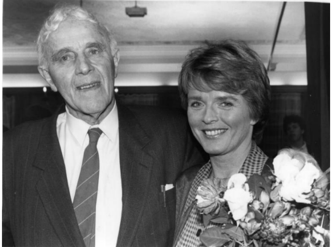
Per Borten og Anne Enger.

I løpet av 1970-tallet vedtok Senterpartiet et nytt prinsippprogram. Partiet satt i to regjeringer sammen med Høyre og KrF, regjeringen Willoch og regjeringen Syse. Da EU-striden blusset opp igjen brøt Senterpartiet med høyresiden. Med en solid plattform basert på desentralisering og økologisk tenking, la Senterpartiet samtidig grunnlaget for en sentrumsblokk i norsk politikk. Ved kommunevalget i 1991 fikk Senterpartiet overraskende stor fremgang. Ved stortingsvalget 1993 var EU-striden fullstendig dominerende i media. Senterpartiet gjorde et brakvalg og ble nest største partiet på Stortinget med 32 representanter. Nei-siden vant som kjent EU-valget i 1994.