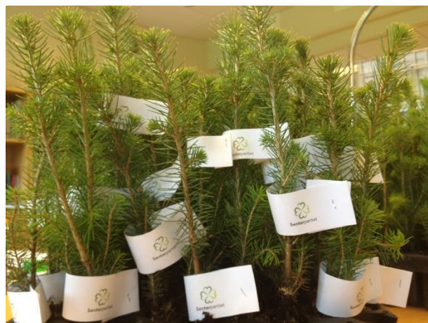
Noen lokallag har tradisjon for å dele ut granplanter på Miljødagen.

Les mer om FNs internasjonale miljødag her: FN-sambandet