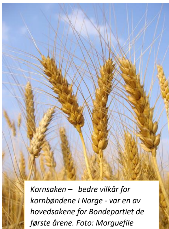
Kornsaken – bedre vilkår for kornbøndene i Norge - var en av hovedsakene for Bondepartiet de første årene.

Senterpartiet ble stiftet på landsmøtet i Norsk Landmandsforbund i 1920 under navnet Bondepartiet. Det nyetablerte Bondepartiet ville fremme norsk matproduksjon gjennom en statsstøtte til kornproduksjon, nydyrking og tollvern for jordbruk, i tillegg til tollerstatning for fiskerinæringen. Samtidig som Bondepartiet forsterket støtten fra Bondebevegelsen, ble det også utviklet en selvstendig politikk med tro på staten som markedsregulator. Mange av partiets folk hadde i flere år innsett at markedskreftene måtte tøyles. Etablering av et omfattende landbrukssamvirke var en følge av dette synet, og et brudd med den gamle økonomiske liberalismen. Arbeiderpartiet og Bondepartiet fant hverandre i synet på behovet for en styringspolitikk. Kriseforliket i 1935 førte Arbeiderpartiet til langvarig regjeringsmakt bygd på filosofien om den aktive stat og slagordet "By og land, hand i hand".