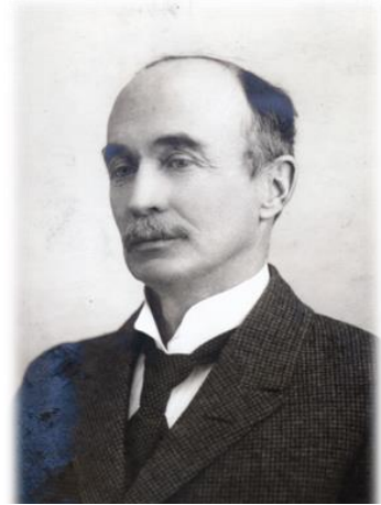
Johan E. Melby ble valgt som første leder av Bondepartiet

Det var ved dette forbundets landsmøte i 1920 at det ble vedtatt at det skulle stiftes et eget politisk parti, Bondepartiet. I 1922 endra Norsk Landmandsforbund navn til Norges Bondelag.