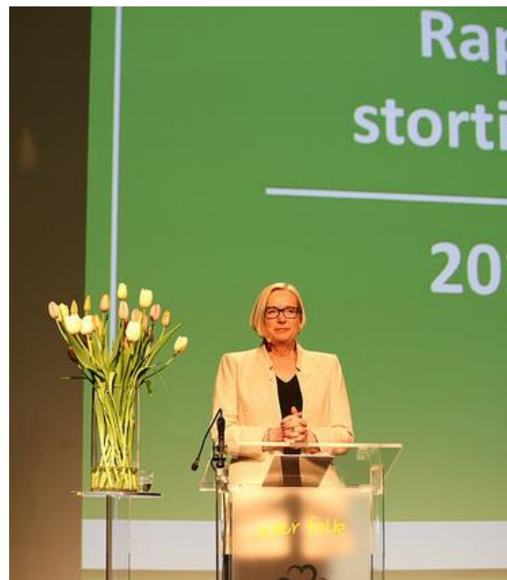
Marit Arnstad taler til Senterpartiets Landsmøte 2017.

Hva så, når vi har vervet flere kvinner til både tillitsverv og folkevalgte verv? Da er det interessant å se på det rapporten «Kvinner politiske interesse og deltakelse» sier om kvinners behov for kompetanse før de tar på seg politisk arbeid.