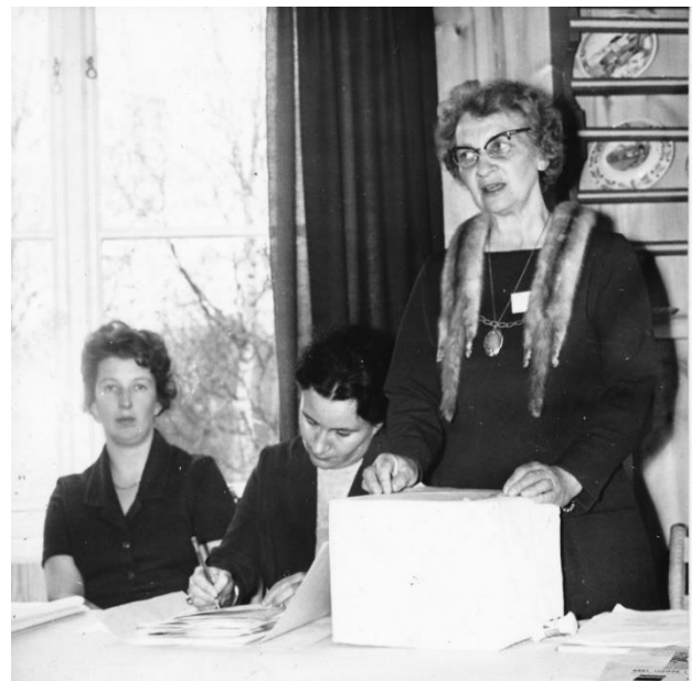
Møte i Senterkvinnene tidlig i 1960-årene.

Kvinnene utgjør halvparten av Norges befolkning, men er jevnt over dårligere representert enn menn i folkevalgte organer. Kjønnsbalansen i politikken burde vært langt bedre enn den er i dag; rett og slett fordi politikk i like stor grad angår både kvinner og menn.