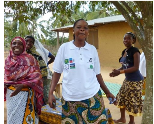
Studieringarbeid i Mtwara.

Senterbevegelsen har lang tradisjon med internasjonalt solidaritetsarbeid, både gjennom støtte til arbeidet til Care i Afrika, og gjennom egne prosjekter i Tanzania.