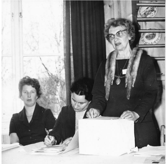
Fra møte i Senterkvinnene tidlig på 1960-tallet.

Kvinnene utgjør halvparten av Norges befolkning, men er jevnt over dårligere representert enn menn i folkevalgte organer. Kjønnbalansen i politikken burde vært langt bedre enn den er i dag; rett og slett fordi politikk i like stor grad angår både kvinner og menn.