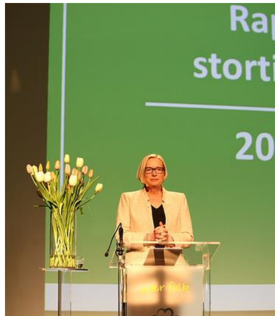
Marit Arnstad taler til Senterpartiets Landsmøte 2017.

Hva så, når man har vervet flere kvinner til både tillitsverv og folkevalgte verv? Da er det interessant å se på det rapporten «Kvinnernes politiske interesse og deltakelse» sier om kvinners behov for kompetanse før de tar på seg politisk arbeid.