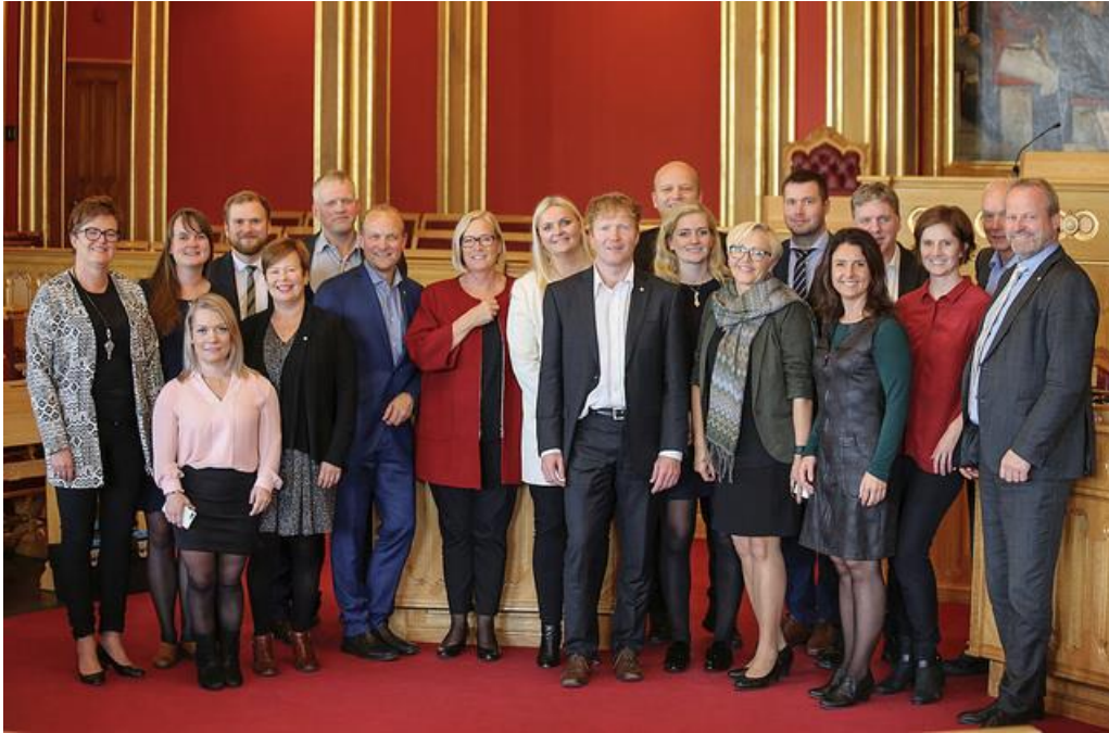
Stortingsgruppa 2017 -2021.